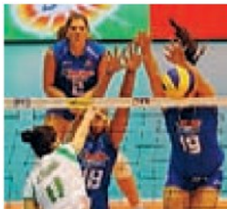
Il muro azzurro Signorile e Folie

>> L'Italia balza in testa alla Coppa del Mondo femminile in Giappone dopo la 5ª giornata. Le ragazze azzurre hanno battuto l'Algeria 3-0 (25-14, 25-14, 25-15) in un'ora e un minuto. Il ct Barbolini ha dato spazio alle seconde linee. In classifica Italia a 14 punti, davanti a Cina e Usa a 12.